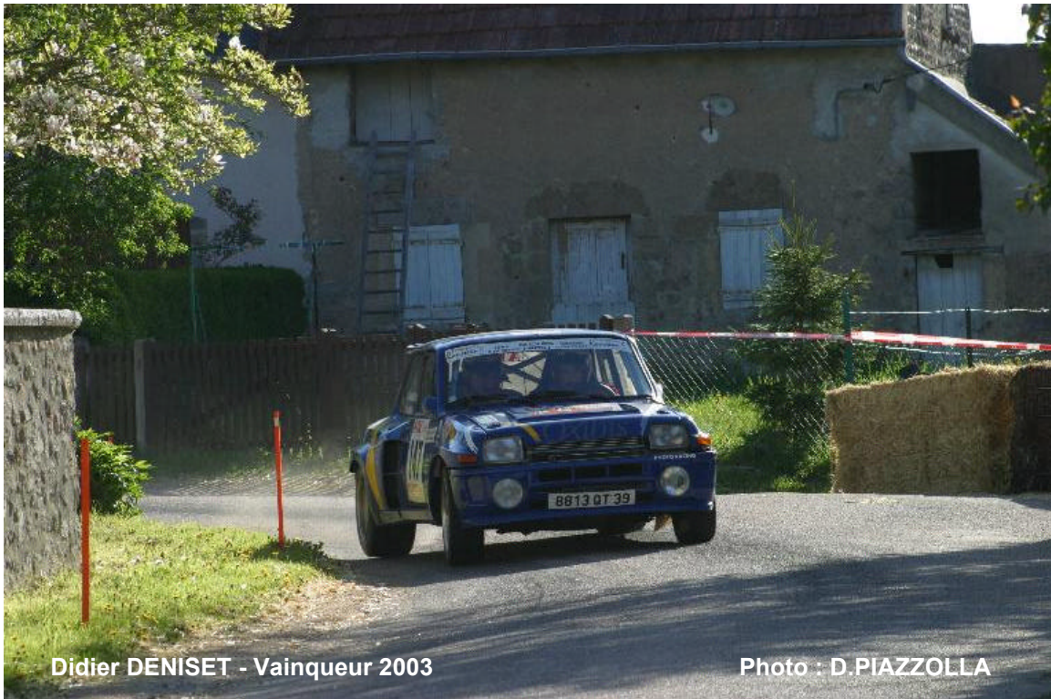
Didier DENISET - Vainqueur 2003